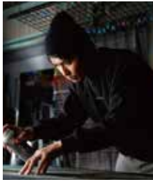
アート作家 RoamCouch (ロームカウチ)

ひろの未来館の壁に壁画アートが出現！作品の仕上げは会場に来たみんなも参加できます。